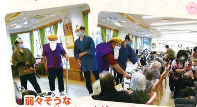
弱々そうな 助さん格さんですが 実は…

3月3日(水)、今年のひな祭りは職員による「水戸黄門」の劇を披露しました。職員それぞれ役になりきりました。ご利用者の皆様に楽しんで頂きました。