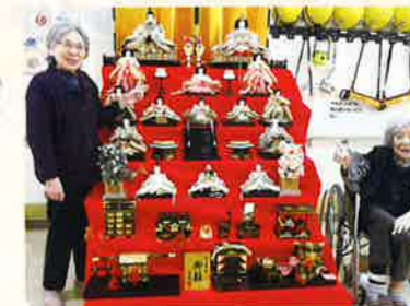
開園当初からある ひな人形の前で 記念撮影!!